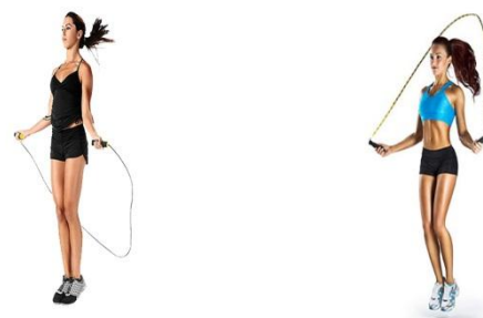
Hình ảnh minh họa nội dung 01

Thí sinh thực hiện 01 lần: Thí sinh thực hiện nhảy dây bằng hai chân, dây nhảy được cầm ở hai tay, thực hiện bật nhảy đưa dây từ trước mặt qua hai chân vòng ra phía sau lưng - qua đầu và về trước, thực hiện liên tục lặp lại trong vòng 01 phút (60 giây). Thành tích được tính theo số lần thí sinh đạt được trong 01 phút, chấm theo thang điểm của Hội đồng tuyển sinh./.