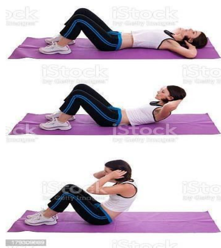
Hình ảnh minh họa nội dung 03

Thí sinh thực hiện 01 lần: Bắt đầu với tư thế nằm ngửa thoải mái trên sàn nhà hoặc thảm tập, hai chân co tạo thành 01 góc 90 độ ở khớp gối và bàn chân đặt trên sàn. Đặt nhẹ các ngón tay đằng sau gáy hoặc hai bên tai, dùng sức nhấc vai lên khỏi mặt sàn hoặc thảm tập đưa thân trên (đầu - vai - ngực) gập tiến sát về hai đầu gối, sau đó hạ thân người, vai chạm sàn hoặc thảm tập và tiếp tục thực hiện liên tục luân phiên trong vòng 01 phút (60 giây). Thành tích tính theo số lần thí sinh đạt được, chấm theo thang điểm của Hội đồng tuyển sinh./.